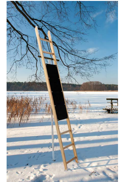
Abb. Bestell-Nr. 120292