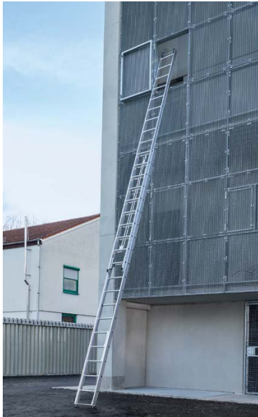
Abb. Bestell-Nr. 116109