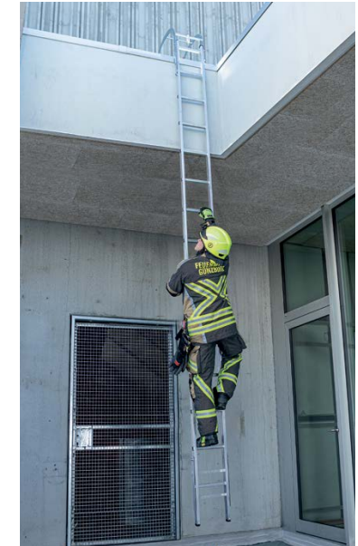
Abb. Bestell-Nr. 116110